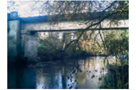
Ponte de Xavarido.