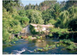
O muíño da Saimía. Aquí se transformaron os cereais en fariña.