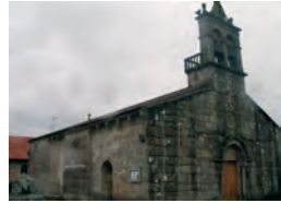
San Fiz de Anllóns, as súas campás lembran a poesía de Ponal.