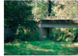
Ponte de Cardezo.