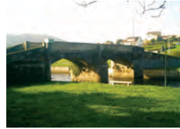
Ponte da Garga.