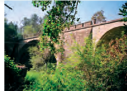
Ponte de Caldas.