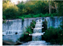
Central Hidroeléctrica do Anllóns.